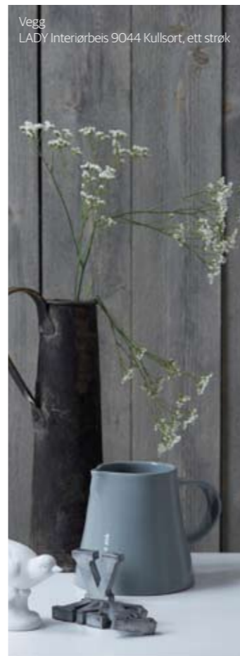
Vegg LADY Interiørbeis 9044 Kullsort , ett strøk