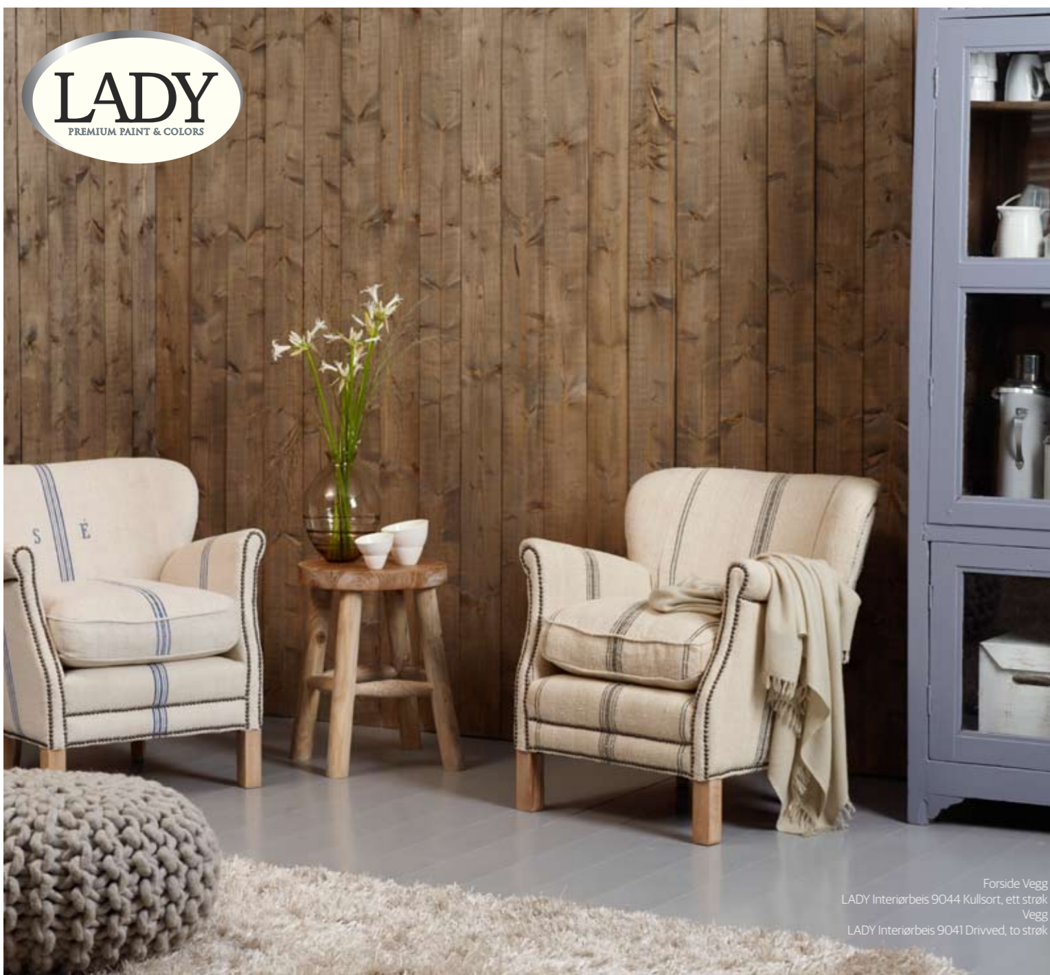
Forside Vegg LADY Interiørbeis 9044 Kullsort, ett strøk Vegg LADY Interiørbeis 9041 Drivved, to strøk