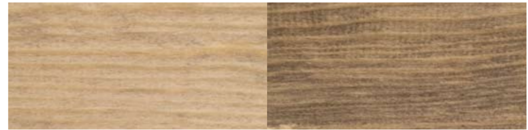
LADY Interiørbeis 9041 Drivved | ett strøk