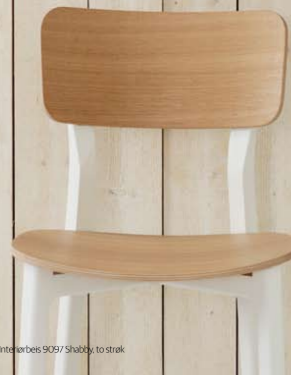
Vegg LADY Interiørbeis 9097 Shabby, to strøk