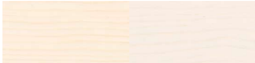
LADY Interiørbeis 9042 Fjære | ett strøk