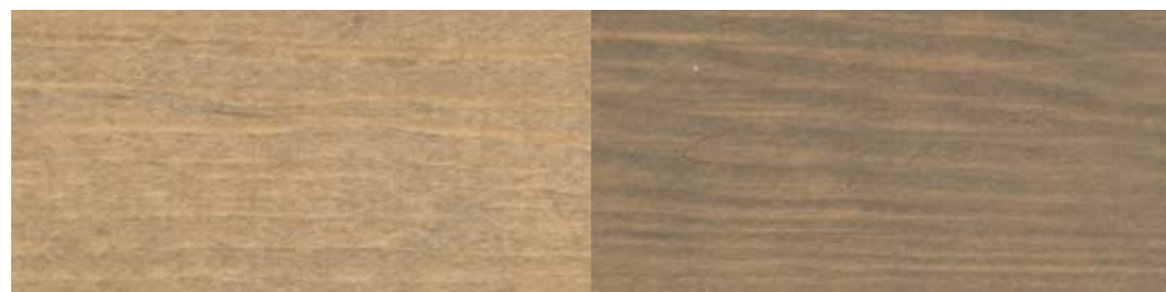
LADY Interiørbeis 9098 Værbitt Tre | ett strøk