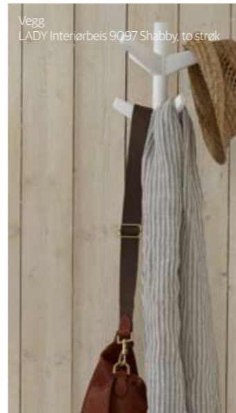
Vegg LADY Interiørbeis 9097 Shabby , to strøk