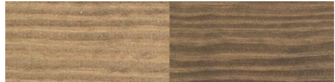
LADY Interiørbeis 9043 Sjøsand | ett strøk